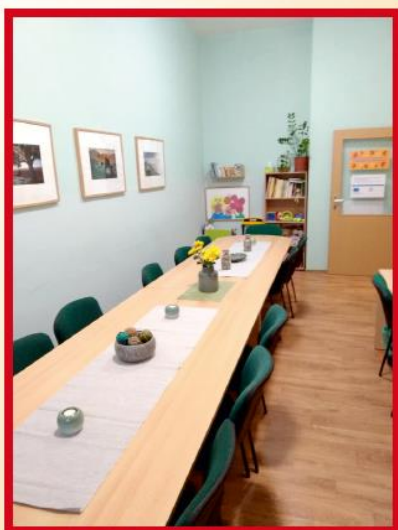
kanceláře SAS, čekárna