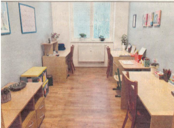
Jedna z nově upravených místností pro potřeby střediska výchovné péče.