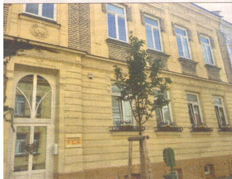
Budova rodinného centra Kroměříž, z. s. a Střediska výchovné péče v Kollárově ulici.